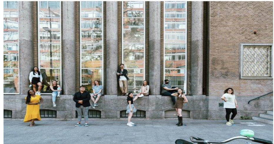
Burgerschapsonderwijs bij de lerarenopleiding maatschappijleer op de Hogeschool van Amsterdam. Op de foto staan voltijdstudenten van het eerste jaar.